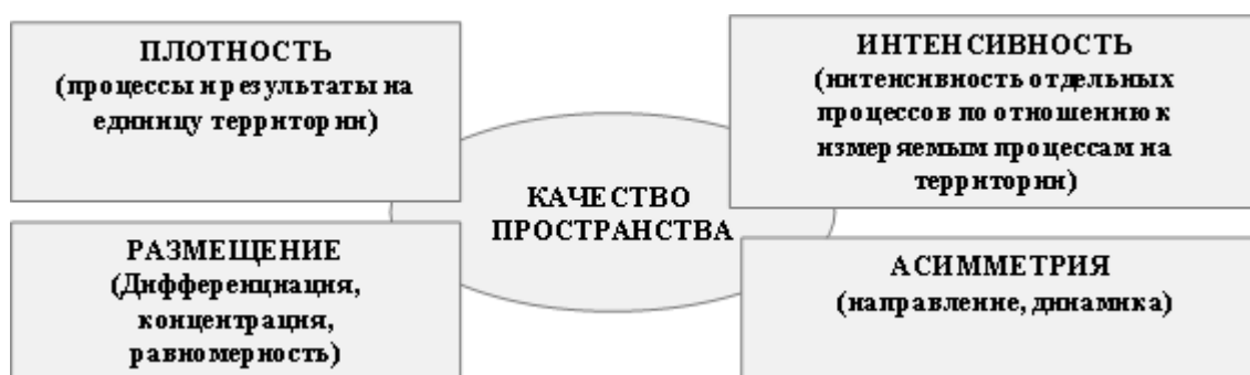
Рисунок 1. Методологический подход к исследованию качества научного, научно-технологического пространства

пространства описывается через такие характеристики, как плотность, размещение, связанность и асимметрии [18]. Плотность экономического пространства отражается через численность населения, объем валового регионального продукта, природные ресурсы, основной капитал и т.д. на единицу пространства или другой совокупности. Размещение описывается через показатели равномерности, дифференциации, концентрации, распределения населения и экономической деятельности, в том числе существование хозяйственно освоенных и неосвоенных территорий. Уровень дифференциации научного пространства может быть измерен как соотношение между максимальным и минимальным значением условных показателей плотности пространства. Кроме того, относительные показатели интенсивности процессов, протекающих в пространстве, могут быть измерены удельными показателями – долей затрат на НИОКР к ВВП/ВРП, численности ученых на 100 тыс. населения и др. По этой же логике может быть проведена оценка плотности и интенсивности других процессов, в частности, инновационных. Учитывая это, качество пространства складывается из следующих характеристик (рисунок 1).