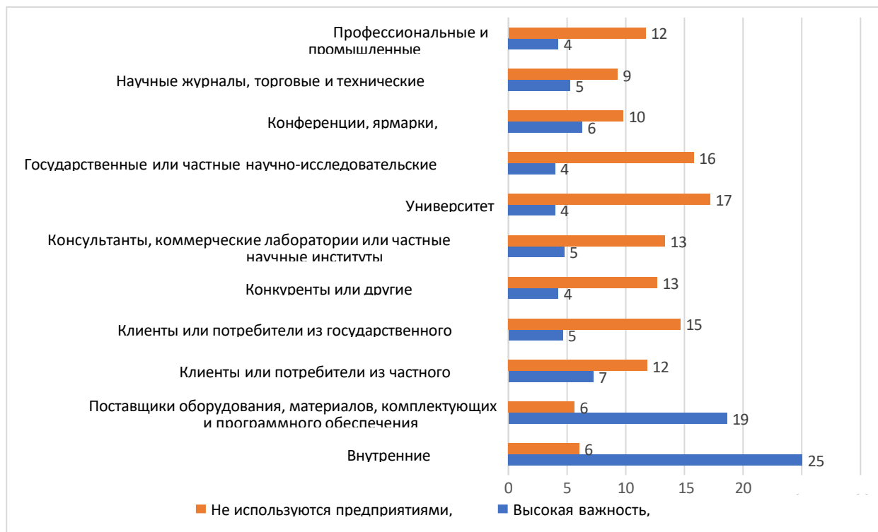
Рисунок 4. Оценки предприятий важности источников, предоставивших информацию для новых проектов или способствовавших завершению существующих инновационных проектов

Учитывая низкую заинтересованность предприятий в результатах НИОКР, можно сделать предположение, что НИОКР и инновации существуют в слабо пересекающихся пространственных коммуникациях. Это может быть объяснено тем, что реализуемые НИОКР слабо связаны с производственно-технологическими задачами предприятий по ряду причин. Во-первых, структуре видов научной деятельности преобладают фундаментальные и прикладные исследования, но остается низким уровень разработок. Следовало ожидать, что с принятием Закона «О коммерциализации результатов научной и научно-технической деятельности» (2015 г.) объем опытно-конструкторских работ и внедрений возрастет. Однако как показывают статистические данные, в абсолютном выражении затраты на опытно-конструкторские работы практически остались неизменными, то есть составили в 2015 г. - 16505,1 млн тенге, а в 2022 г. - 16611,4 млн. тенге. Соответственно, доля в затратах сократилась с 2015 г. к 2022 году с 23% до 13%. Во-вторых, одной из причин может быть приоритет, отдаваемый в оценке результативности науки наукометрическим, в частности библиометрическим показателям. В-третьих, причины кроются в самой структуре промышленного производства, где остается низкой доля наукоемких производств и отраслей, являющихся основными потребителями НИОКР